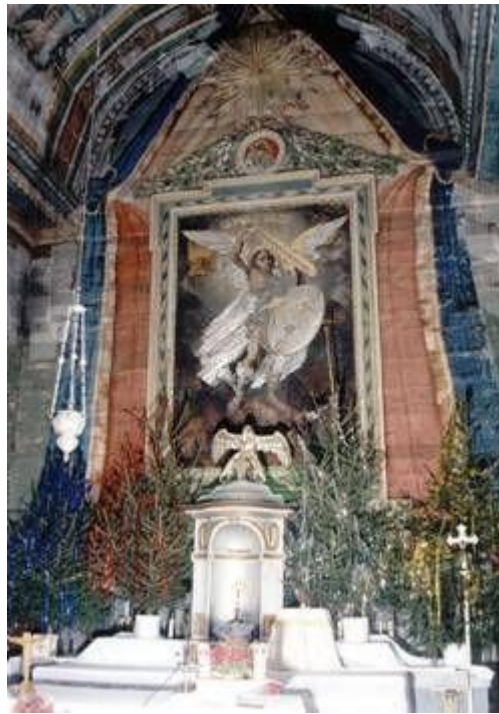
Obraz św. Michała Anioła

W ołtarzu głównym znajduje się przepiękny obraz św. Michała Anioła i niezwykle tabernakulum, nad którym ustawiono rzeźbę srebrnego pelikana – symbol miłości rodzicielskiej.