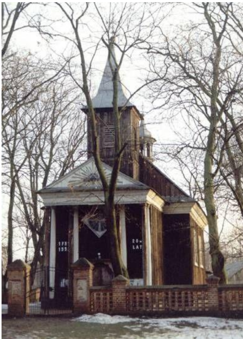
Kościół parafialny rzymskokatolicki pw. św. Michała Archanioła

Wśród zabytków wpisanych do rejestru wojewódzkiego konserwatora zabytków znajduje się także Pałac z 3 ćwierci XIX w. wybudowany przez Ignacego Płaskowskiego. Dwór usytuowany został w środkowej części parku z fasadą skierowaną w kierunku południowym, z odchyleniem z stronę wschodnią. Pałac zbudowany jest w stylu saskim z piękną cylindryczną wieżą.