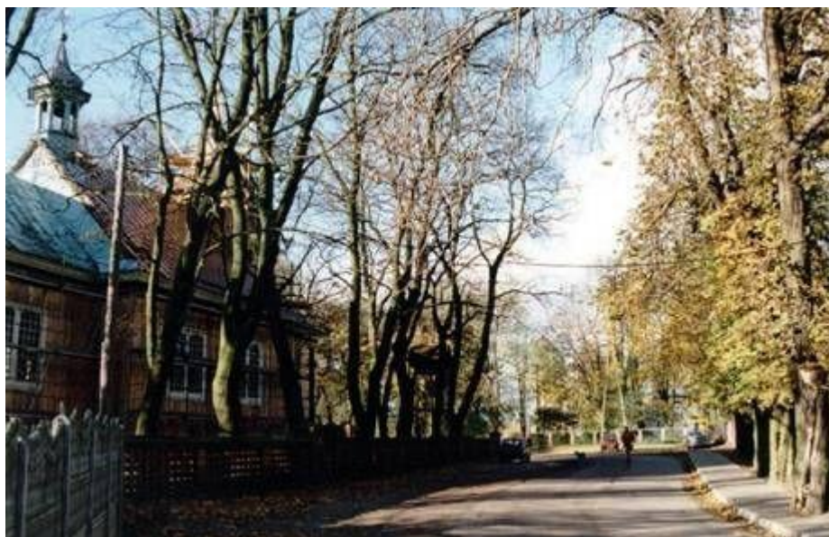
Aleja 12 kasztanowców

W Czarnem występuje pomnik przyrody, który stanowi aleja 12 kasztanowców znajdująca się naprzeciw Kościoła, park dworski wpisany do rejestru konserwatora zabytków, w którego centrum jest dwór murowany z XIX w. – gdzie mieści się obecna Szkoła Podstawowa.