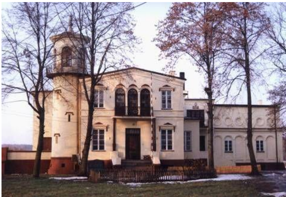
Pałac w Czarnem – obecna Szkoła Podstawowa

W ewidencji konserwatorskiej wpisane są także takie obiekty jak: