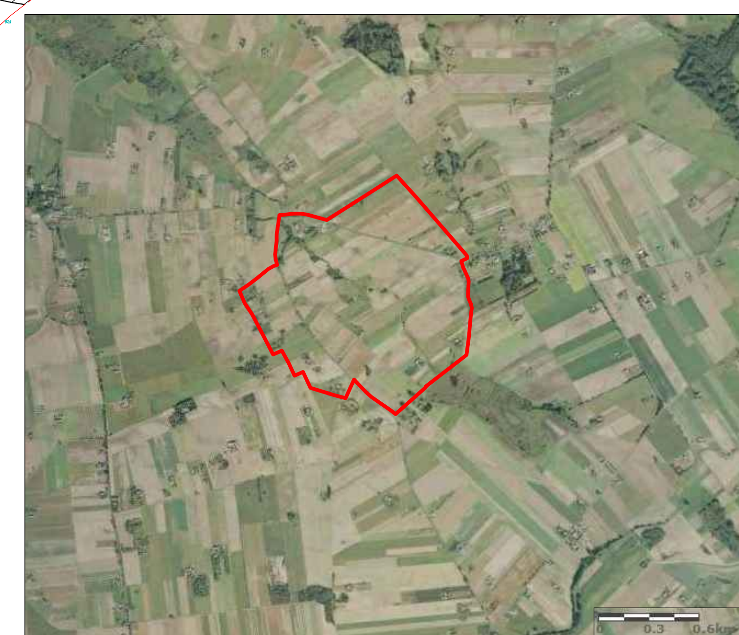
ORTOFOTOMAPA TERENU OPRACOWANIA

województwo pomorskie powiat lipnowski gmina Wielgie obręb: Oleszno, Zadzuszniak, Szpiegowo, Kisielewo