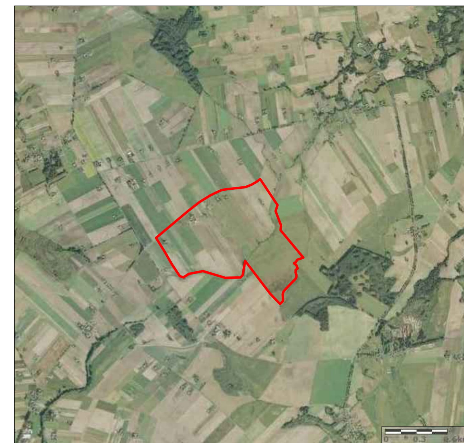
ORTOFOTOMAPA TERENU OPRACOWANIA