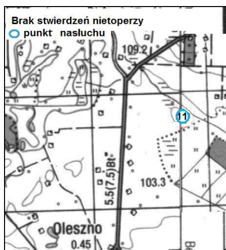
Rys. 4. Brak stwierdzenia aktywności gatunków nietoperzy w monitorowanych punktach zlokalizowanych na południe od m. Wielgie (okolice m. Oleszno) w okresie tworzenia kolonii rozrodczych i rozrodu

Na obszarze opracowania nie odnotowano aktywności nietoperzy zarówno w okresie tworzenia kolonii rozrodczych i rozrodu jak i w okresie rozpadu kolonii rozrodczych i jesiennych migracji