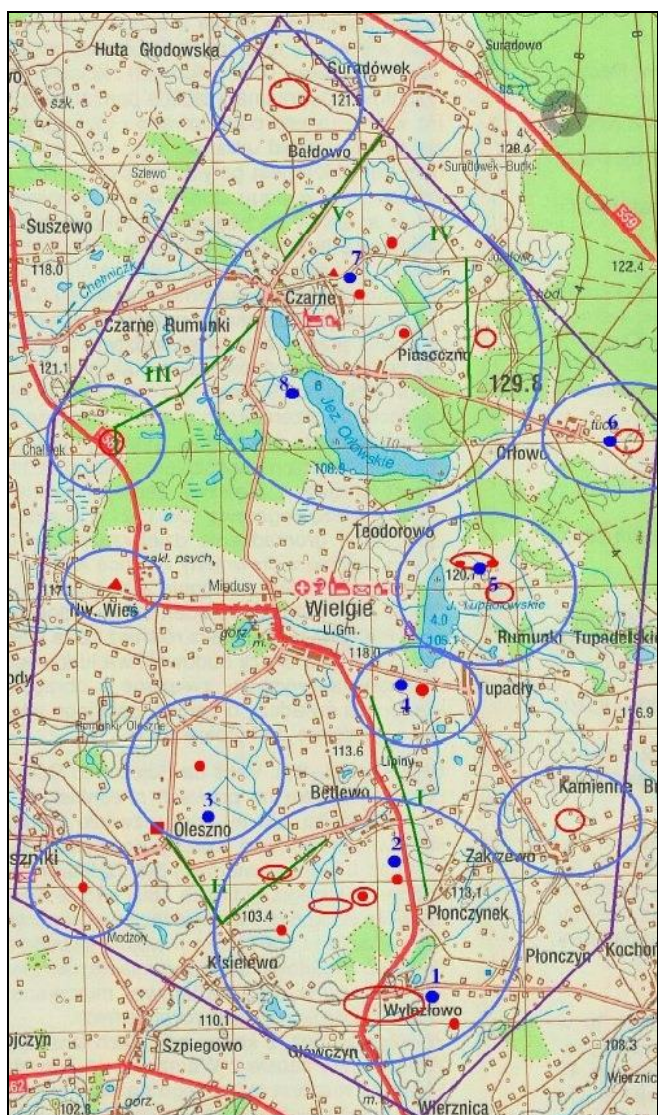
Rys. 2. Obszar planowanej farmy wiatrowej „Wielgie” wraz z terenem buforowym - granica oznaczona kolorem fioletowym; punkty czerwone i obszary ograniczone czerwoną linią – miejsca planowanych lokalizacji siłowni; obszary ograniczone niebieską linią – obszary otulinowe; 1 - 8 – punkty obserwacyjne; I - V – trasy transektów; Linie zielone – trasy transektów; punkty niebieskie – punkty obserwacji stacjonarnych. Bok kwadratu siatki geograficznej – 2 km.

Na przedmiotowym obszarze rolnicze tereny otwarte z lasami i zadrzewieniami, zbiornikami wodnymi z charakterystyczną roślinnością stanowią siedliska zwierząt. Sąsiadujące z lasami i zadrzewieniami tereny otwarte stanowią istotne tereny łowne i miejsce żerowania wielu gatunków zwierząt (m.in. mysz leśna, sarna, jeleń, łoś, dzik, zając szarak, lis). Bogata jest entomofauna (odnotowywane licznie gatunki chrząszczy, motyli, ważek) i awifauna. Przedrealizacyjny monitoring awifauny występującej na projektowanej farmie wiatrowej „Wielgie” (rys. 2), przeprowadzono w okresie od początku marca 2009 r. do końca lutego 2010 r. W wyniku obserwacji na badanym obszarze stwierdzono występowanie 142 gatunków ptaków. Wśród nich środowiskowo najliczniejszą grupę stanowiły ptaki związane z biotopami leśnymi i zadrzewieniami, a następnie gatunki polne i łąkowe, ptaki związane z wodami i terenami podmokłymi, osiedlami ludzkimi oraz gatunki tylko przelotne, incydentalne lub wszędobylskie.