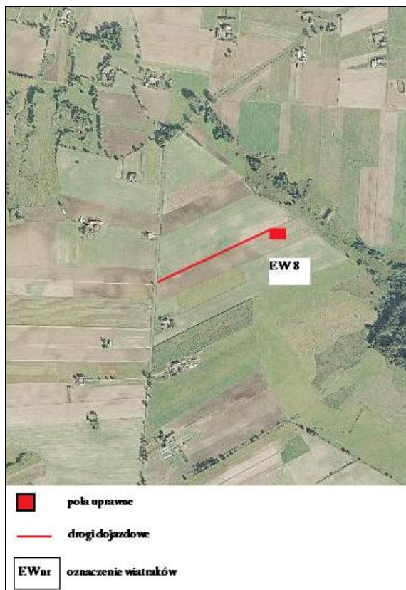
Rys. 1. Ortofotomapa z wyszczególnieniem chronionych siedlisk i gatunków roślin na terenach lokalizacji elektrowni wiatrowej E8 – brak gatunków i siedlisk chronionych.

Lokalizacja projektowanych elektrowni wiatrowych względem chronionych siedlisk i stanowisk gatunków roślin