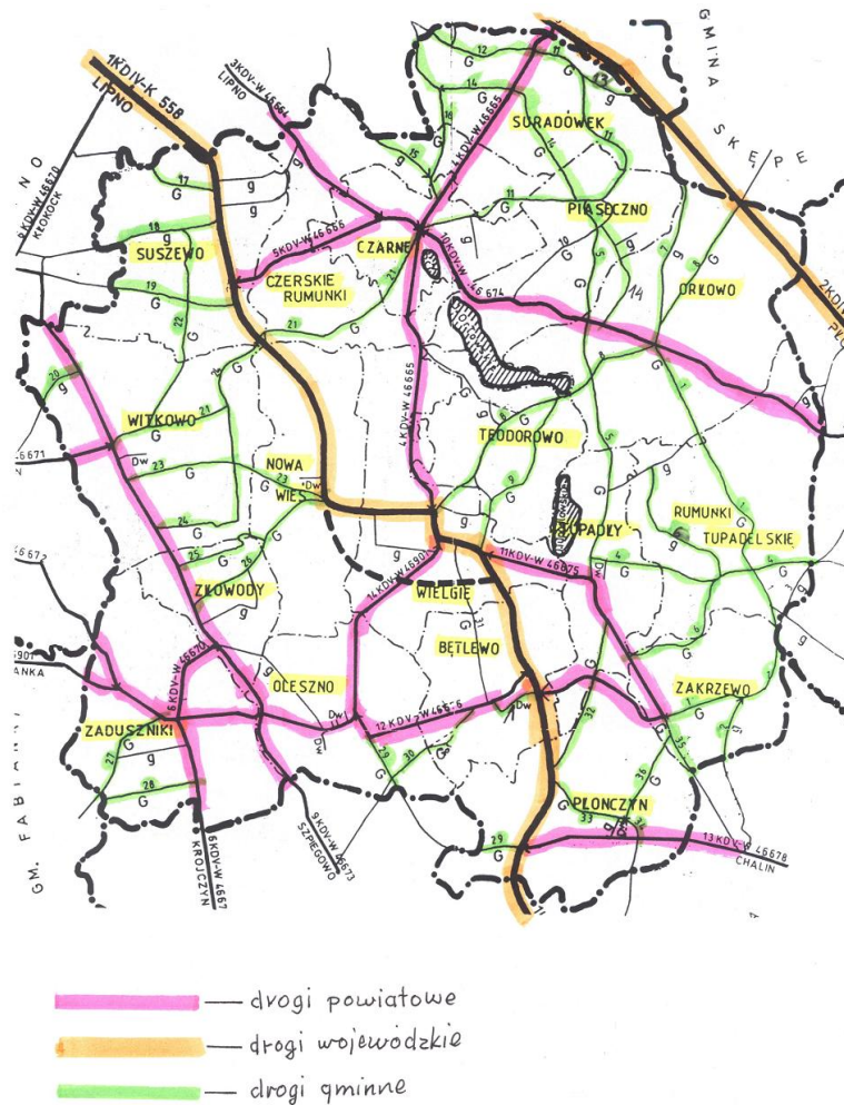
Mapka Gminy - Drogi