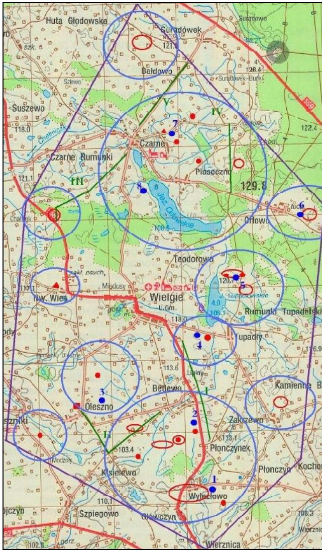
Rys. 2. Obszar planowanej farmy wiatrowej `Wielgie` wraz z terenem buforowym - granica oznaczona kolorem fioletowym; punkty czerwone i obszary ograniczone czerwoną linią – miejsca planowanych lokalizacji siłowni; obszary ograniczone niebieską linią – obszary otulinowe; 1 - 8 – punkty obserwacyjne; I - V – trasy transektów; Linie zielone – trasy transektów; punkty niebieskie – punkty obserwacji stacjonarnych. Bok kwadratu siatki geograficznej – 2 km.