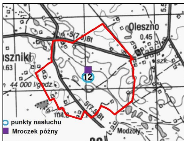
Rys. 4. Stwierdzenia aktywności gatunków nietoperzy w monitorowanych punktach (okolice m. Oleszno i Zaduszniki) w okresie tworzenia kolonii rozrodczych i rozrodu w obrębie obszaru opracowania (linia czerwona)

Aktywność nietoperzy w okresie rozpadu kolonii rozrodczych i jesiennych migracji jest mniejsza. W porównaniu z okresem funkcjonowania kolonii rozrodczych ze stwierdzonych gatunków nietoperzy nie odnotowano żadnego w granicach opracowania.